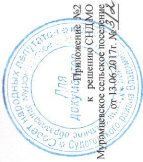
Графическое изображение схемы избирательных округов по выборам представительного органа местного самоуправления муниципального образования Муромецкое сельское поселение